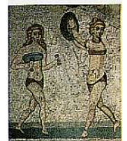
Frauen mit Boxhandschuhen und einem Diskus oder Ball. Vermutlich handelt es sich nicht um Sportlerinnen, sondern um Schauspielerinnen oder Tänzerinnen. Mosaik, Piazza Armerina, Sizilien, 3. oder 4. Jahrhundert n. Chr.